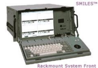
Rackmount System Front

SMILES™ ist ein leistungsfähiges System zur Modernisierung alter Standard NTDS Geräte. Mit moderner Technik ersetzt SMILES™ alternde Einheiten, die oft nur noch schwer und kostenintensiv zu erhalten sind und verbessert gleichzeitig die Funktionalität und Bedienbarkeit. Dabei kann ein einziges SMILES™ System eine Vielzahl von veralteten NTDS Konsolen oder Peripheriegeräten ersetzen.