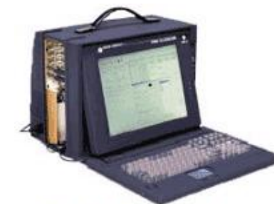
NIA II™ Portable

Sabtech's NTDS-Analysesystem NIA-II™ ist ein leistungsfähiges Werkzeug, das Daten von 2 aktiv kommunizierenden NTDS-Einheiten abgreift und sehr einfach zu benutzen ist. NIA-II™ bietet den Einblick, der erforderlich ist, um Zeitbezüge, Protokolle, Durchsatz und Datenintegrität aller NTDS Typen zu analysieren. Es ist ein unverzichtbares Werkzeug für alle, die Entwicklung, Wartung und Analyse von NTDS Systemen betreiben.