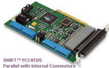
SWIFT™ PCI NTDS Parallel with Internal Connectors

Sabtech's Swift™ Familie von NTDS Baugruppen unterstützt alle bekannten PCI-Versionen, einschließlich PMC und cPCI. Die umfangreichen Funktionen vereinfachen die Programmierung und die Vielzahl der Betriebsmodi ermöglichen jedes NTDS Protokoll. Sie sind als NTDS-Interface genauso geeignet, wie als Anzapfmodul für bestehende Verbindungen. Der eingebaute Zeitstempel mit 125ns Auflösung erlaubt viele spezielle